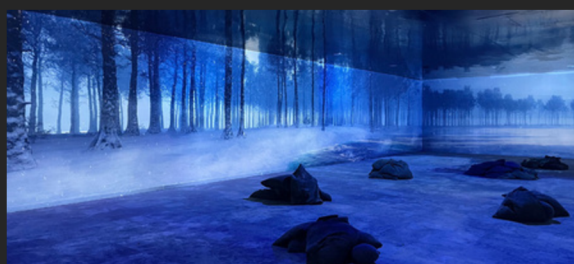
Forêt scandinave enneigée