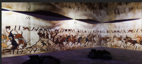
Tapissérie de Bayeux