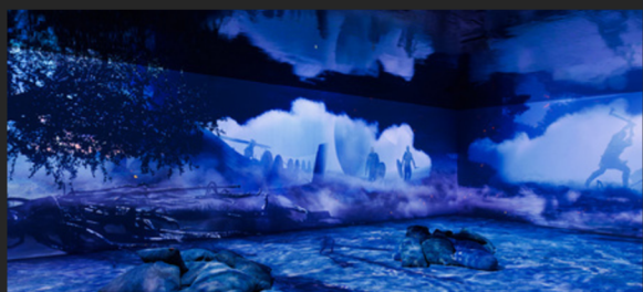
Scène de guerre viking